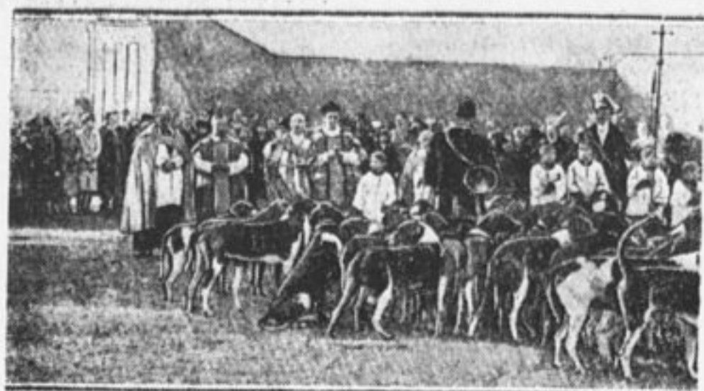
День св. Гюберта, покровителя охоты. «Благословение собак».