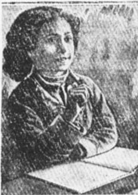
Школьница-цыганка, выступающая на всесоюзном радиослете.