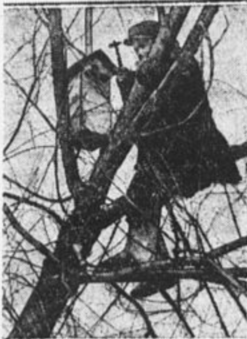
Москвичи готовятся к встрече гостей.

Конференцией был принят сводный наказ, где собраны предложения